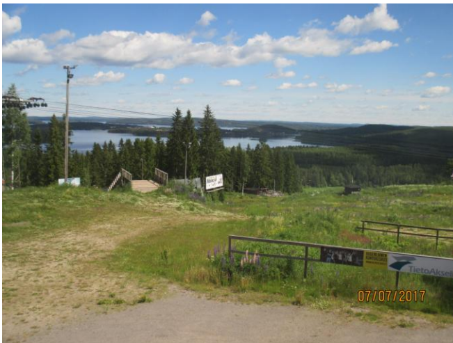
Laskettelupaikka, kun on, niin on rinteet ja niitä on 9 kpl ja korkeuseroa 120 m