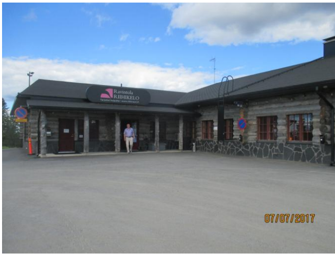
Siinä kokoustilamme ulkopäin. Tämäkin isosta kelosta rakennettu respa-ravintola-neuvarit on vuodelta 2010