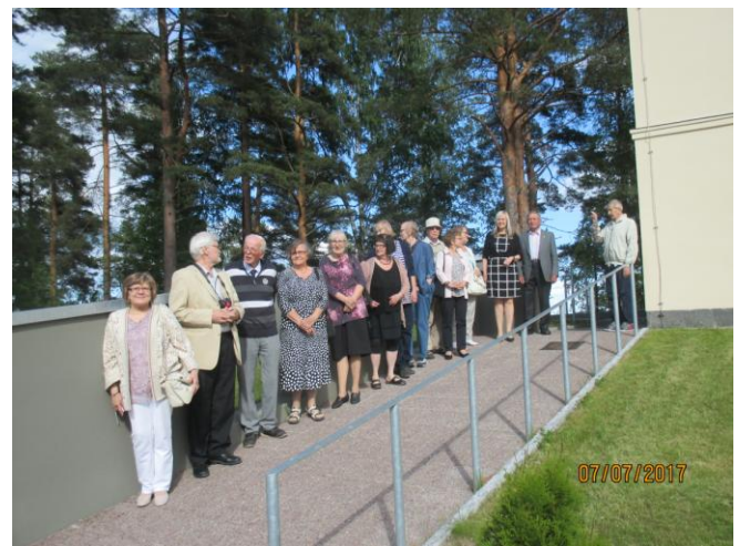
Siinä joukkoamme poistumassa kirkosta