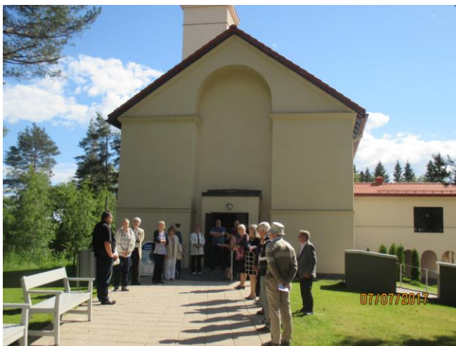
Olemme menossa tutustumaan Muuramen kirkkoon. Se on Alvar Aallon aikaista tuotantoa. On muuten näkemisen arvoinen. Pienihän se on, mutta todella kaunis