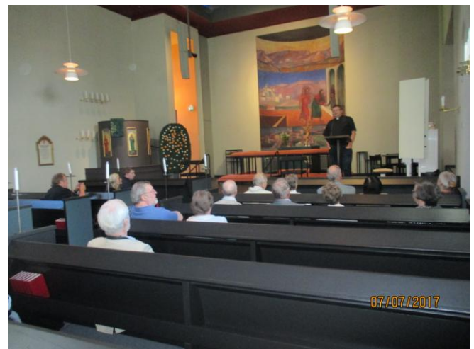
Tässä kuvassa näkyy alttaritaulun olevan pyöreässä syvennyksessä. Taulu esittää Jeesusta parantamassa sairaita.