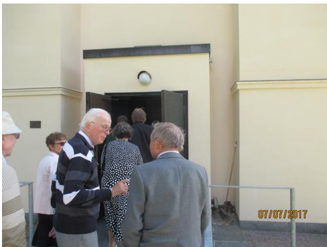
Siinä viimeiset menossa kirkkoon Alvar Aallon ajatuksen mukaan ahtaasta portista