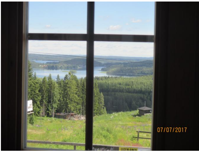
Näkymä ruokapaikkamme ikkunasta